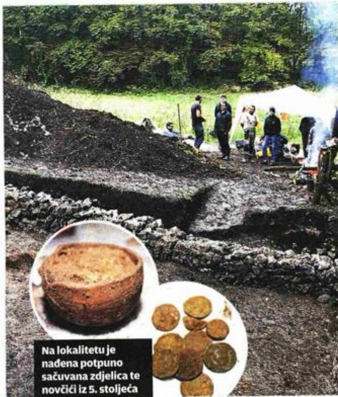
Na lokalitetu je nađena potpuno sačuvana zdjelica te novčići iz 5. stoljeća

čuvala vrijedna trgovačka i vojna cesta koja je spajala Sisak i Senj. U utvrdi je bilo malo vojske, isprva je tu živio samo zapovjednik, dok je lokalno stanovništvo obrađivalo zemlju uz rijeku.