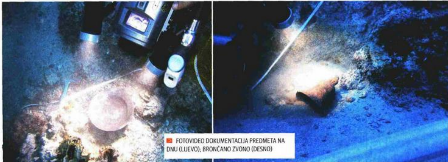
FOTOVIDEO DOKUMENTACIJA PREDMETA NA DNU (LIJEVO); BRONČANO ZVONO (DESNO)

zaštićenim zonama imaju koncesiju. Mlet je bio, a i danas je na plovnom putu, tako da zapravo ne čudi bogatstvo podmorja što se tiče brodoloma iz raznih vremenskih perioda, od antike do novog vijeka", tumači koautor izložbe i podvodni arheolog Igor Miholjek.