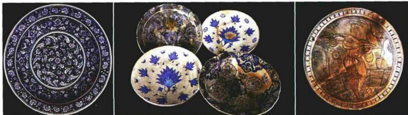
NAJBRojNIJE I NAJBOLJE OČUVANO JE KERAMIČKO POSUĐE IZ IZNIKA I PRONAĐENO JE PREKO ŠEZDESET PRIMJERAKA, A IZLOŽENA SU PEDESEST I TRI KOMADA

Ovo luksuzno posuđe proizašlo je iz istih keramičkih radionica kao i oslikane zidne pločice kojima su i danas obložene najpoznatija povijesna zdanja u Turskoj poput Topkapi palače, džamije Ibrahim-paše, Rustem-paše i Sulejmana Veličanstvenog te mnogih drugih. Ove radionice su zahvaljujući pokroviteljstvu osmanskog dvora u razdoblju od 1480. do 1670.