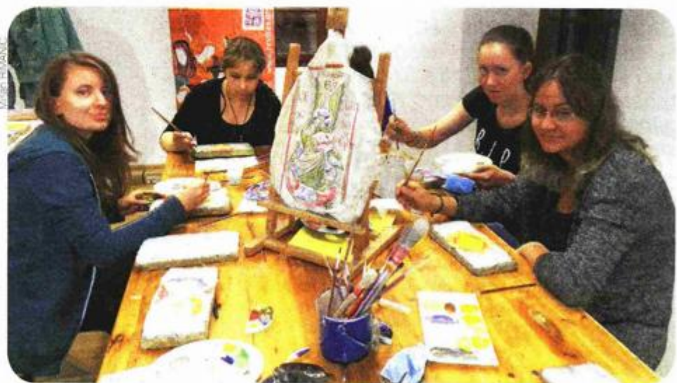
Iz radionice slikanja fresaka