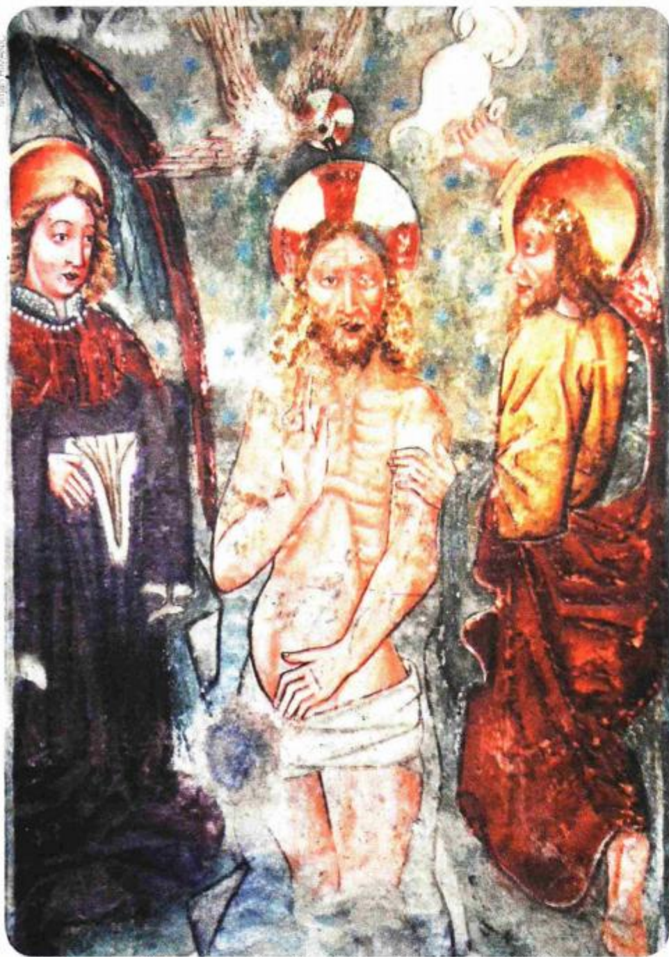
Freske mogu postati vrlo važan motiv za dolazak i boravak turista u unutrašnjosti Istre