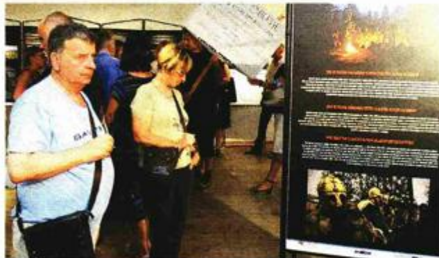
Baština od velike važnosti na panoima

Virtualna crta koja povezuje sve zidove specifičnog spomenika duga je približno 130 kilometara