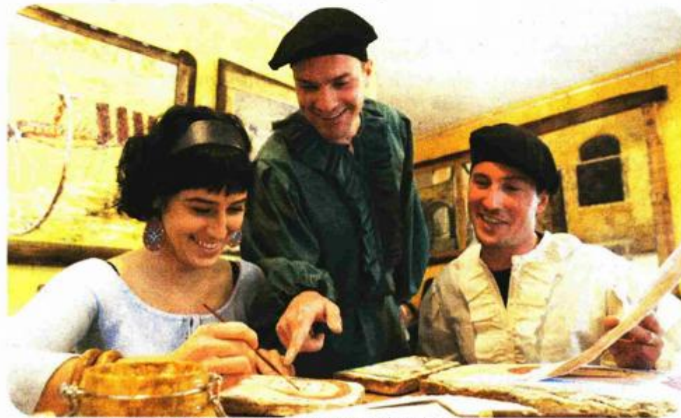
Tijekom ljeta predviđene su i radionice o zidnom (fresko) slikarstvu

Tijekom lipnja i srpnja u Draguću će se održati i Međunarodna likov-