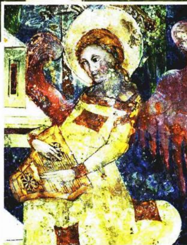
Reprodukcija freske iz Zminja bit će izložena u Kući fresaka