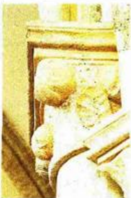
JEDNOSTAVNA I DIVNA Crkva Uznesenja Blažene Djevice Marije u Gori relativno je malena, površine od tek 120 četvornih metara. Planira se da postane marijansko središte Sisačke biskupije. Iako su župljani pomalo žalili za starom, baroknom crkvom, počeli su ovih dana već održavati u njoj vjenčanja...