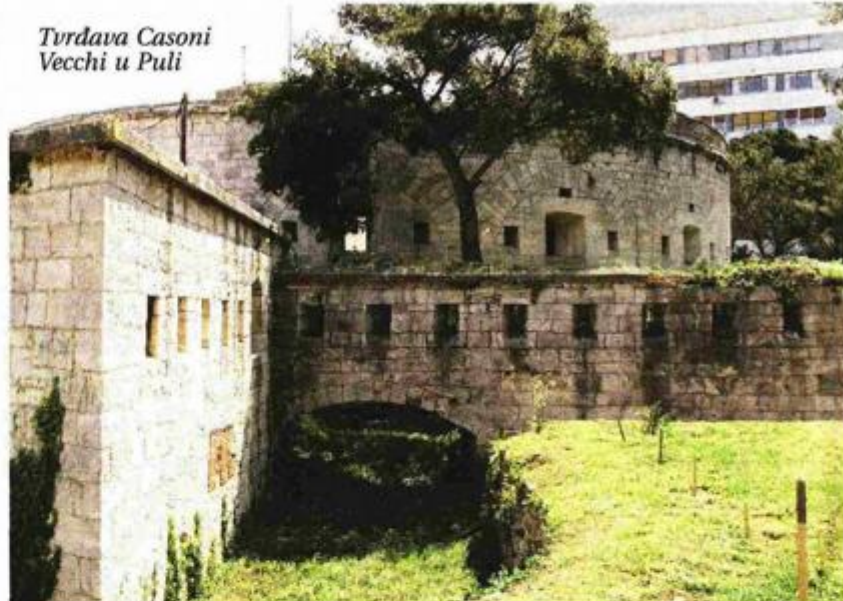
Tvrđava Casoni Vecchi u Puli