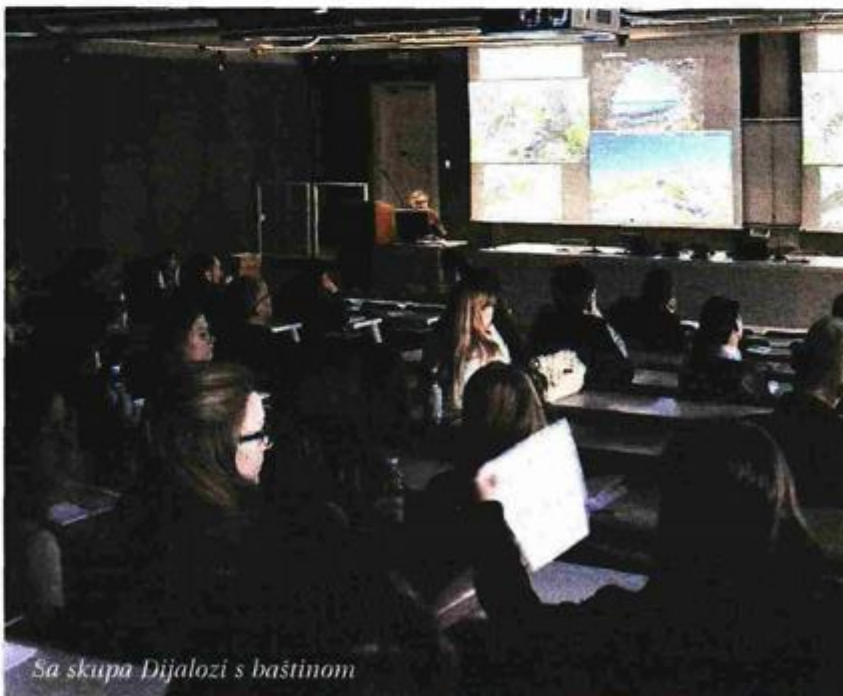
Sa skupa Dijalozi s baštinom