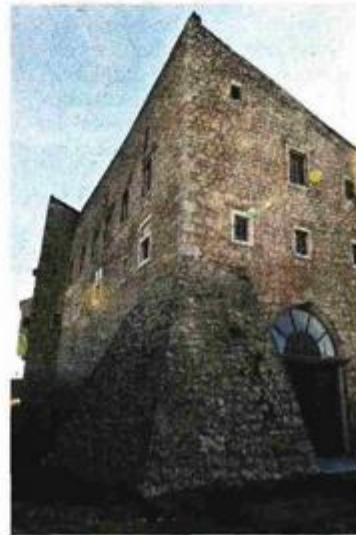
Kontinuirana obnova – Grobnički kaštel

O nelogičnoj i neracionalnoj raspodjeli imovine zbog neprepoznavanja cjelovitosti fenomena teritorijalne tvrđave i neriješenih imovin-