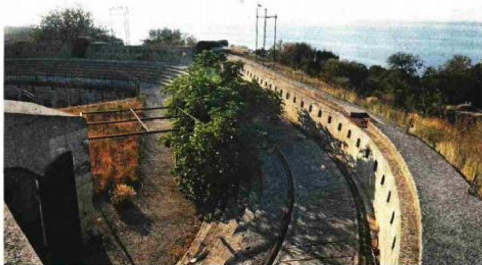
Utrda Minor na Malom Brijunu

iji Katedre za istraživanje i zaštitu baštine na Odsjeku za povijest umjetnosti Filozofskog fakulteta u Rijeci