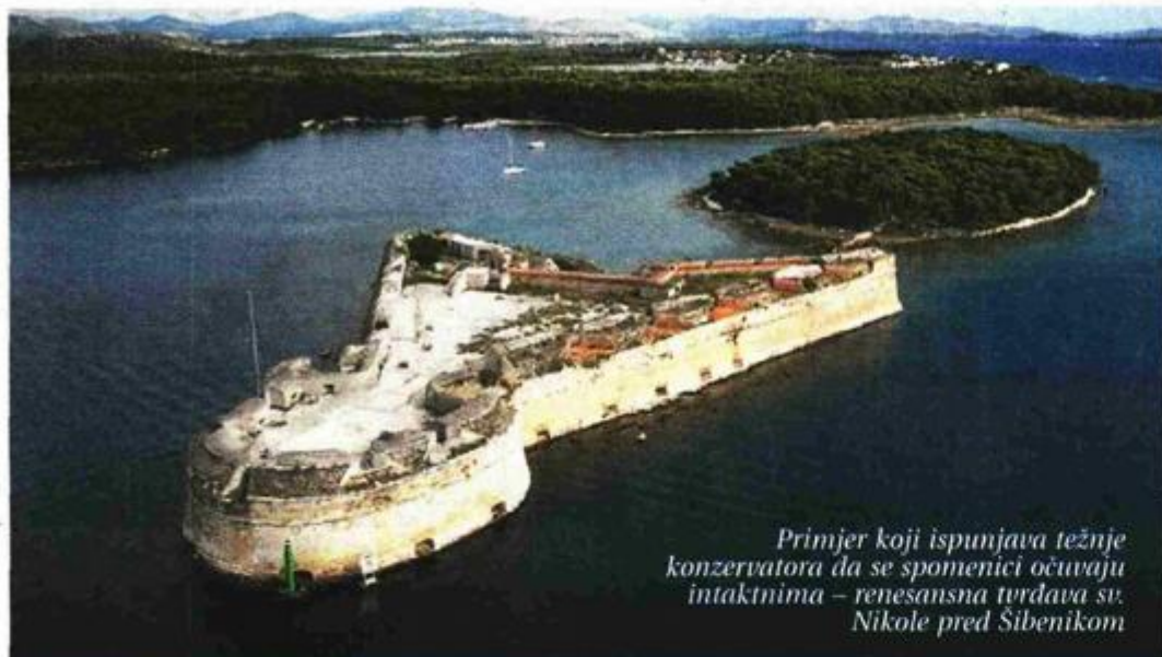
Primjer koji ispunjava težnje konzervatora da se spomenici očuvaju intaktnima – renesansna tvrđava sv. Nikole pred Šibenikom