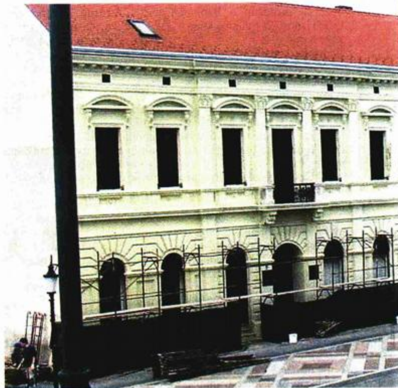
Restauracija kuće, koja bi trebala postati muzej, potrajat će godinama