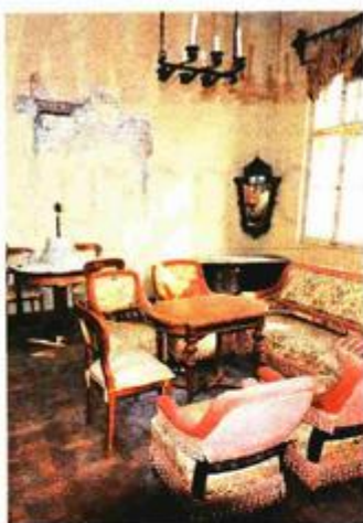
U devastiranoj unutrašnjosti ipak se osjeća duh Ivanina vremena