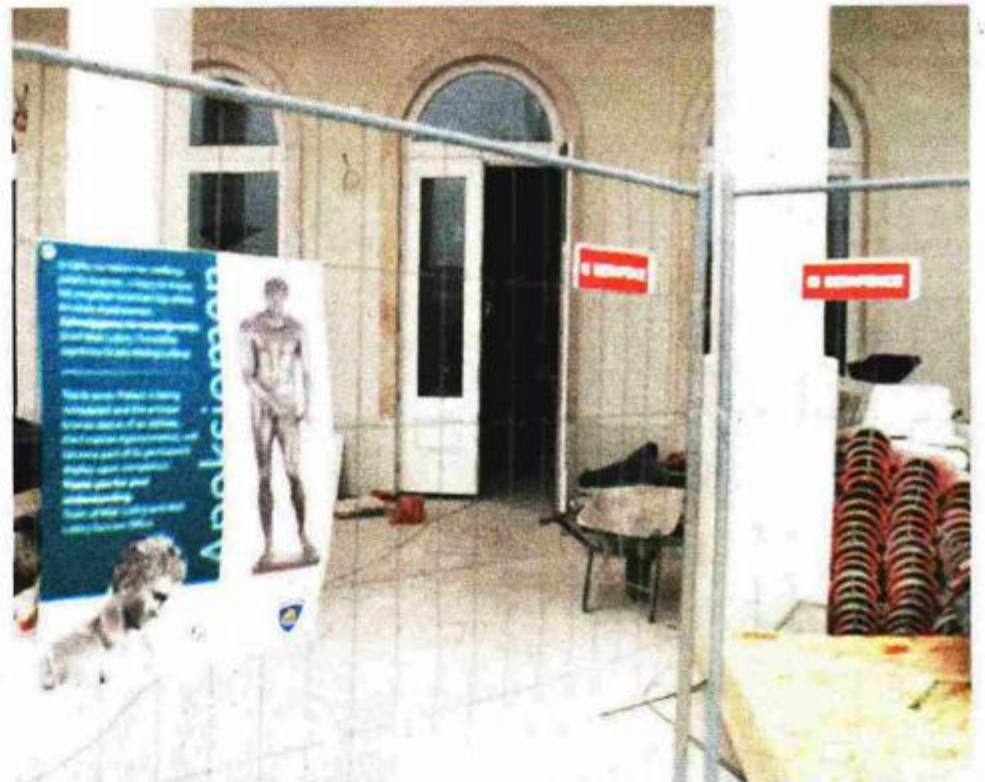
Nikad kraja - rokovi za dovršenje Apoksiomenovog doma stalno se pomiču

Dok se zauvijek ne skrasi u Malom Lošinju antička će skulptura Apoksiomena ipak vidjeti svijeta. U njoj će od 26. ožujka do 5. srpnja uživati Londončani i tamošnji turisti, jer će biti izložena na izložbi »Defining beauty: body in ancient Greek art« u British Museumu. Iz Londona će se skulptura direktno transportirati u John Paul Getty Museum u Los Angelesu, gdje će se tijekom održavanja izložbe u Los Angelesu održati i 19.