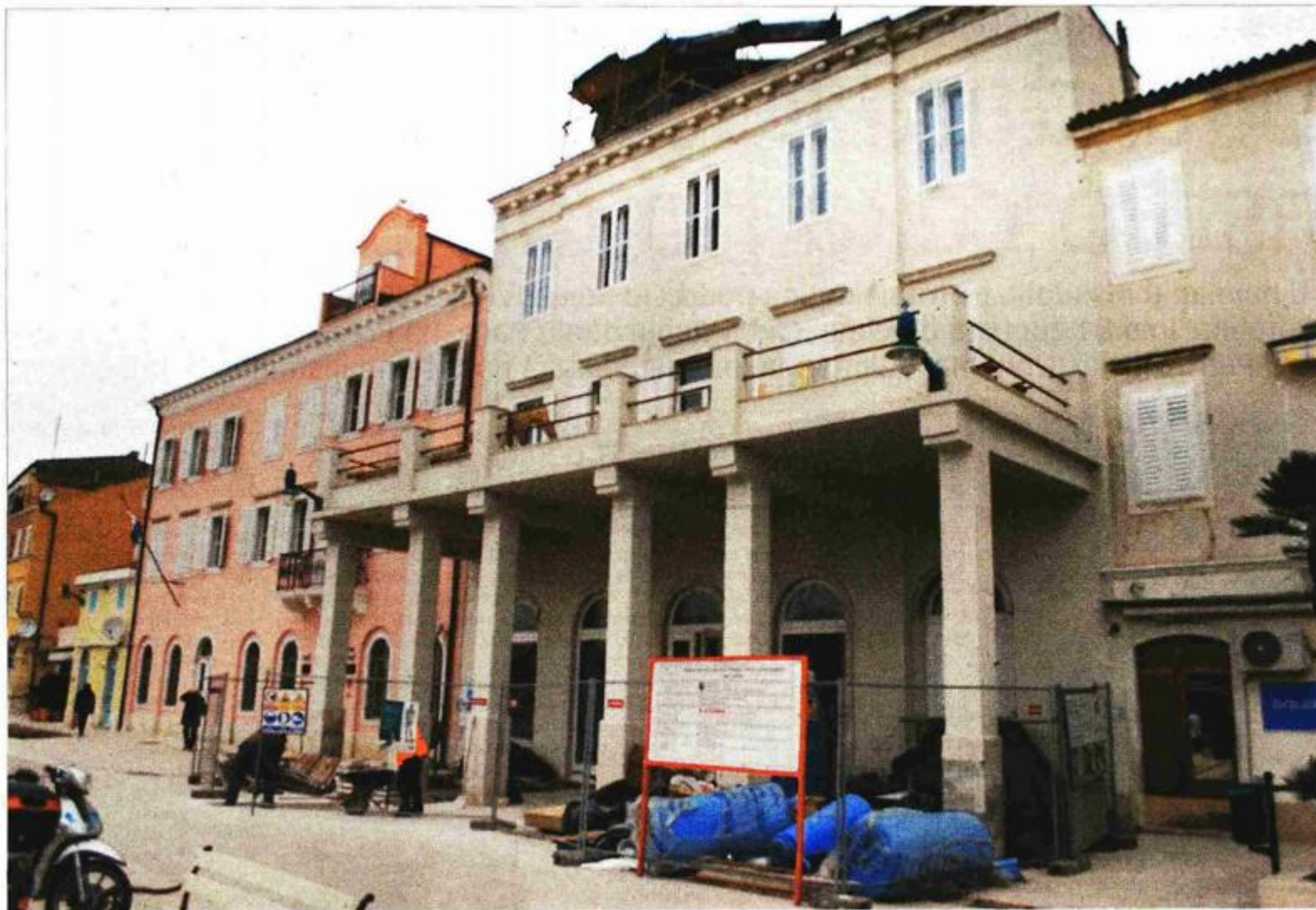
Palača Kvarner postat će Muzej Apoksiomena - radovi se ipak približavaju kraju