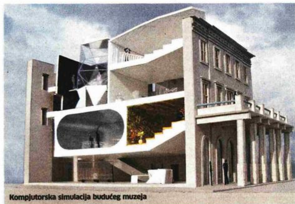
Kompjutorska simulacija budućeg muzeja

građevinsko-obrtničkih radova i opreme projekta muzejskog postava za muzej Apoksiomena. Predzadnjeg dana prosinca 2014. sklopljen je ugovor o izvođenju navedenih radova s tvrtkom Radnik d.d. u iznosu od 3,7 milijuna kuna s PDV-om te rokom izvedbe od 90 dana.