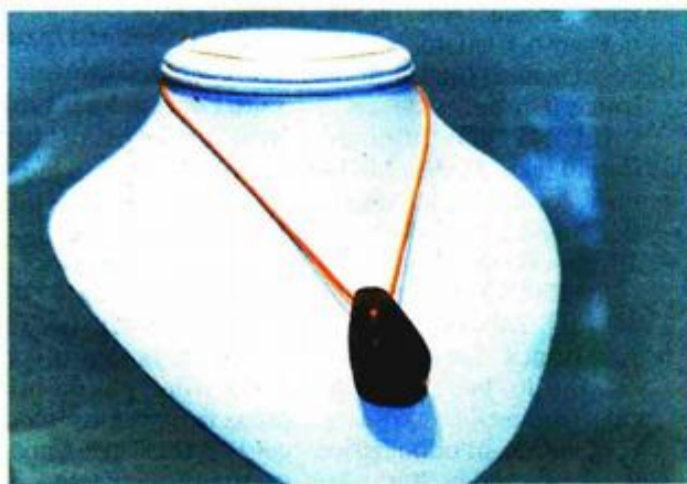
Posebno je vrijedan nalaz privjesak od minerala apatita

Kako su tijekom otvorenja izložbe rekli ravnatelj Arheološkog muzeja Istre Darko Komšo i Tihomir Percan iz Hrvatskog restauratorskog