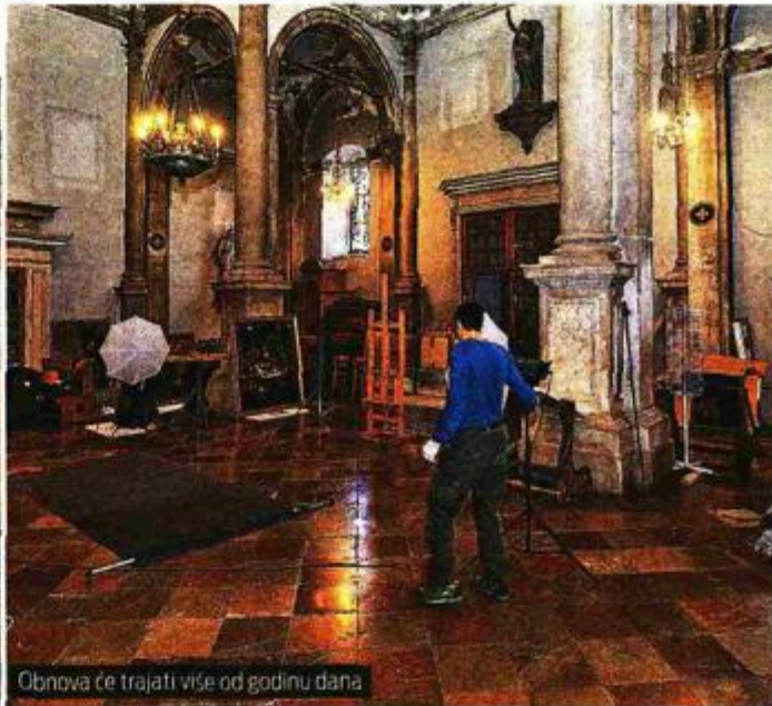
Obnova će trajati više od godinu dana