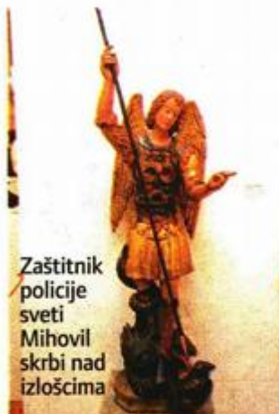
Zaštitnik policije sveti Mihovil skrbi nad izlošcima