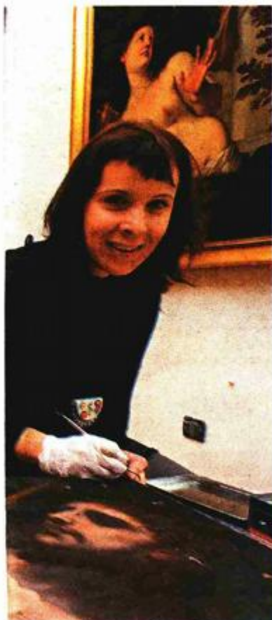
la bi pozirale našem fotoreporteru