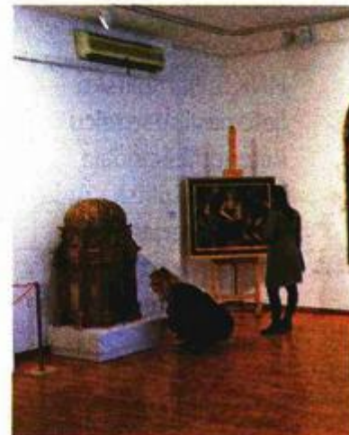
Posjetitelj su spremni i na zahtjevne k