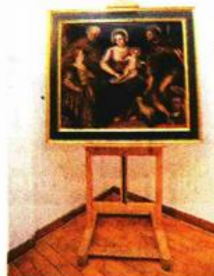
Bogorodica sa Djetetom