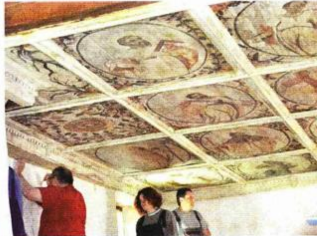
Restauratori postavljaju obnovljeni tabulat

gurao 30 tisuća kuna, kaže Emina Svilar stručna suradnica za kulturu u Gradu Pa-