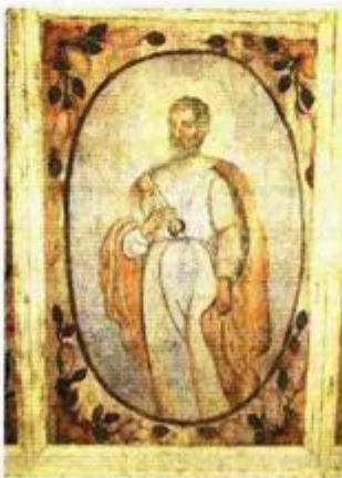
Sv. Petar na tabulatu

ne zaštite, osnovnog čišćenja oslika, podlijepljivanja slojeva podloge i boje na drveni nosač, konsolidacije nosača, odstranjivanja sloja vaska stavljenog kod jedne od kasnijih obnova. Slijedila je stolarska sanacija tabulata, rekonstruiranje oštećenja drvenog nosača rezbarenjem, rekonstruiranje oštećenja nosača kitanjem, rekonstruiranje oštećenja u sloju podloge i retuš. Potom je uslijedilo zaštitno lakiranje, stolarska sanacija vijenca i profiliranih ukrasnih letvi, kitanje i retuš dijelova vijenca i profiliranih letvi i konačno uspješna montaža tabulata u kapele koja je obavljena od 15. do 26. rujna, kaže Galović. Ona veli da je kapela u međuvremenu potpuno sanirana i više nema prodiranja vode u interijer, a ni prekomjerne vlage u unutrašnjosti crkve.