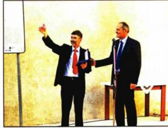
Simbolična predaja ključeva i kule u turističke svrhe