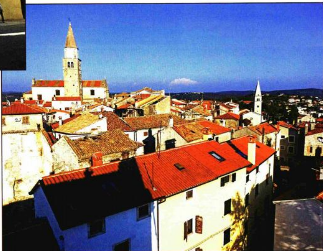
Pogled na Buju s vrha kule sv. Martina

- Takvi zaključci temelje se na nekoliko činjenica, prije svega njen peterokutni tlocrt koji je karakterističan za razdoblje eksperimentiranja u gradnji fortifikacija protiv artiljerije te konzole pri vrhu kule koje ukazuju na stilska obilježja karakteristična za mletačke fortifikacijske gradnje kasnogotičkog razdoblja. Uz to, indikativan je i naziv ovog dijela grada Villa, što bi moglo ukazivati kako se radilo o dijelu grada koji pr-