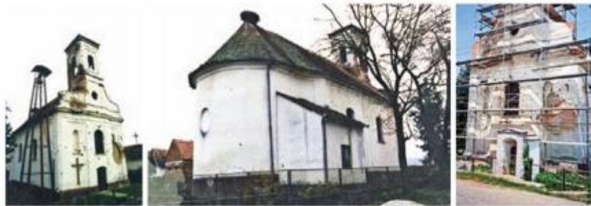
Fotografije zatečenog stanja prije obnove s vidljivim oštećenjima crkve u Domovinskom ratu

■ Župna crkva sv. Mihovila Arkandela u Dubočcu zaštićeno je nepokretno kulturno dobro Republike Hrvatske, registrirano pod brojem Z-1681. U tijeku su završni radovi obnove vanjskog dijela, pročelja crkve temeljem izrađene konzervatorske i tehničke dokumentacije te obnova i restauracija unutrašnjosti i inventara koju prati Ministarstvo kulture. Obnovu vrijednih dijelova inventara izvode stručnjaci iz Hrvatskog restauratorskog zavoda.