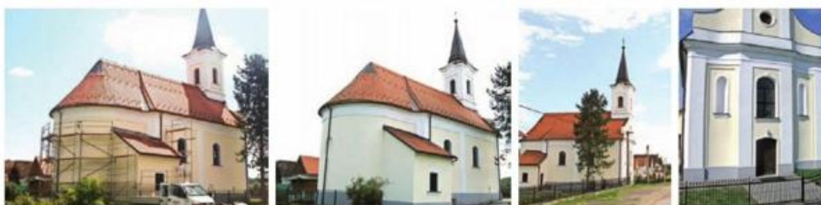
Fotografija obnovljenih pročelja crkve i detalj ulaznog pročelja