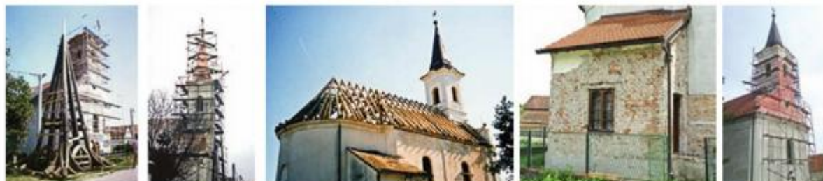
Fotografije s prikazom detalja tijekom radova obnove crkve

Završni radovi su pri kraju, a tijekom obnove biti će prikazan u okviru izložbe kojim Ministarstvo kulture planira obilježiti Dne europske baštine 2014. godine. (nastavlja se)