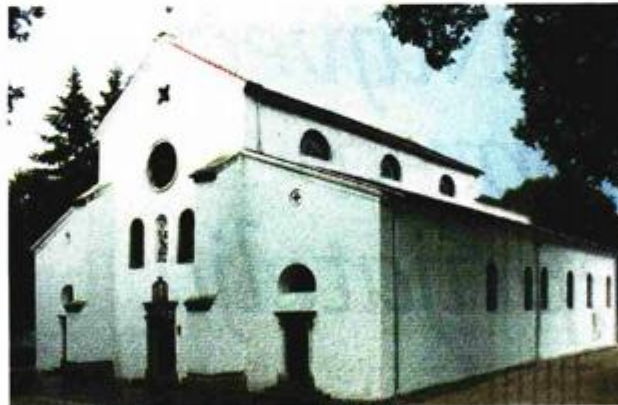
Crkva sv. Nikole

F reske u prvoj luneti južnog zida svetišta crkve sv. Nikole u Pazinu osvanule su u novim, svježijim bojama, a za to su zaslužne Kristina Krulić i Fani Župan, konzervatorice-restauratorice Hrvatskog restauratorskog zavoda. One su od naslaga nečistoća, koje su se na freskama desetljećima taložile, očistile dio slikanog sloja koji je sada na svjetlo dana izašao u originalnim bojama. Sada slijede laboratorijska ispitivanja pigmenta i veziva u Prirodoslovnom laboratoriju Hrvatskog restauratorskog zavoda kao priprema za veći zahvat, a to su radovi na svodnom osliku svetišta.