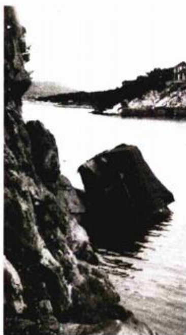
Stare fotografije njemačke torpiljarke