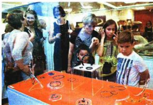
Medulinsko područje jedno je od najzdašnjeg za arheologe

U galeriji Loža Udruga MedulinArt postavila je izložbu "Antika u očima umjetnika", a proslava je okrunjena nastupom grupe Sakramenska dica.