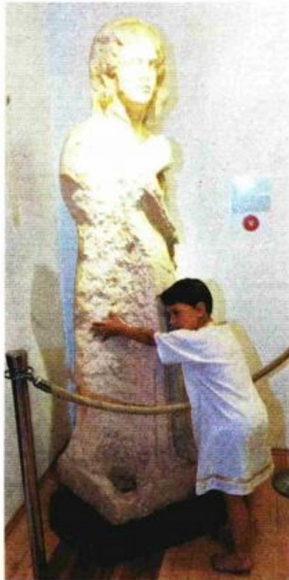
"Domina" iz vinkuranskog kamenoloma