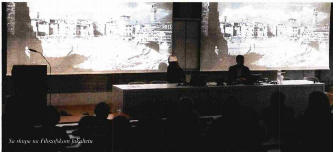
Sa skupa na Filozofskom fakultetu

D evastacija nacionalnih spomenika najveće vrijednosti, onih koji su prepoznati i kao svjetska baština, u Hrvatskoj nije rezultat samo bespravni intervencija nestručnjaka već jednako tako i pogrešaka koje se događaju pri institucionalnom djelovanju nadležne Uprave Ministarstva kulture. Dok Ministarstvo tolerira slučajeve poput spomenika Kristu koji je zaklonio pogled na glasoviti Radovanov portal, glavni ulaz trogirске katedrale, ne treba se čuditi nelegalnim zahvatima na baštini, jer oni zapravo imaju dozvolu.