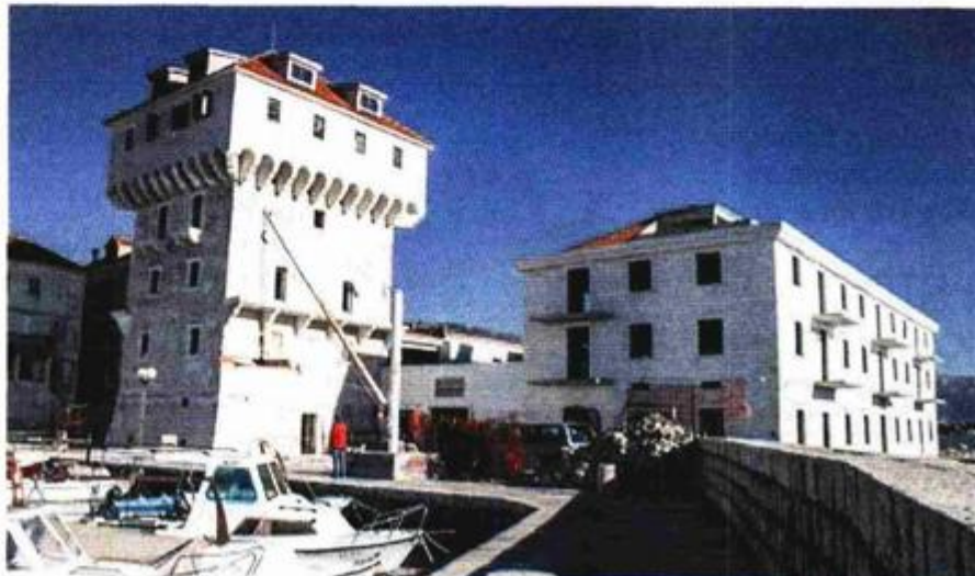
Eklatantan primjer devastacije Kula Cipicco

Tvornički kompleks uključuje više zgrada i vrlo je uspješni urbanistički sklop s interesantnim arhitektonskim kreacijama, a 80 godina