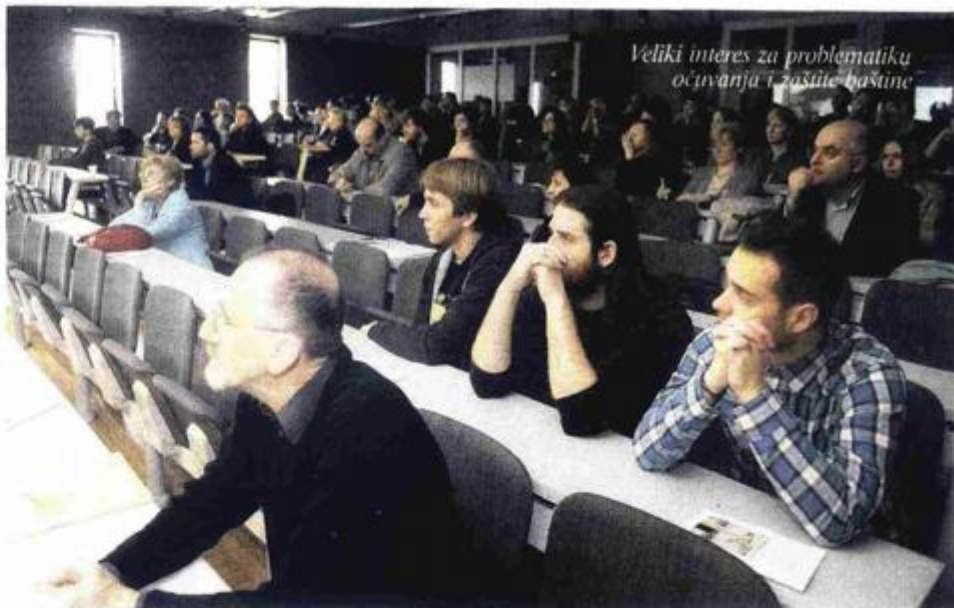
Veliki interes za problematiku očuvanja i zaštite baštine

o je niz povjesničara umjetnosti i konzervatora na temi »Slika spomenika i princip promjene«