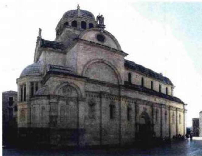
Katedrala sv. Jakova u Šibeniku

Nela VALERJEV OGURLIĆ