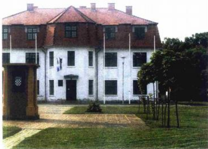
1. PONOS MJESTA: Vila Neuschloss iz 1909., bivši DIK-ov ljetnikovac, nakon rekonstrukcije postaje centar kulturnih zbivanja...