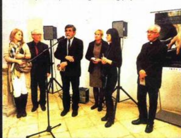
Suradnici – predstavljači osobitog izložbenog projekta

● “Projekt Dubrovački evanđelista bavi se dvjema cjelinama s prikazom četiriju evanđelista iz crkava Gospe od Karmena i Svetog Vlaha, pripisanim radionici priznatog talijanskog baroknog umjetnika i viteza Malteškog reda, Mattije Pretija”