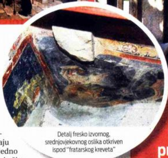
Detalj fresko izvornog, srednjovjekovnog oslika otkriven ispod "fratarskog kreveta"

A da je ovaj srednjovjekovni samostanski kompleks bio bogat zidnim oslikom stoljećima ranije, svjedoče otkrića fragmentarnog zidnog oslika iz 14. stoljeća na prvom katu istočnog krila otkrivena 2004., danas skrivenog "ispod fratarskog kreveta". Fresko slikarstvo koje je izvorno resilo zidove sakristije. Naknadnom ugradnjom jedrastog svoda umjesto završne ravne površine sakristije, freske su, danas sačuvane fragmentarno, ostale iznad svoda u međuprostoru, praktično ispod poda fratarskih soba. Pogledu su dostupne kroz uspostavl-