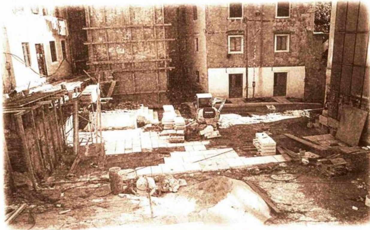
Ostaci rimske povijesti na koje se nadgradila arhitektura prošlog stoljeća. Trg je ureden prema projektu arhitekta Nenada Fabijanića.

U priči je važno da Grad Rijeka dobiva na prostoru rimskog principija novi javni prostor, Arheološki park , na oko 700 četvornih metara u vrijednosti od oko 8,8 milijuna kuna. Razmišljajući o uređenju, Fabijanić je imao na umu da je Rijeka sklona eksperimentalnim istraživanjima svih