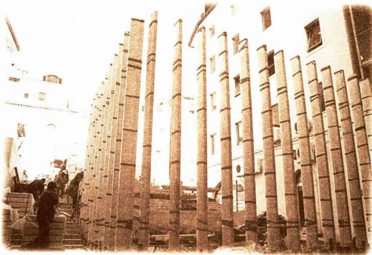
Arheološki park Principij postaje mjesto susreta povijesti i sadašnjosti, trg na kojem će se odvijati kulturni sadržaji