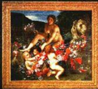
VENERINA TOALETA ULJENA PLATNU IZ 17. ST.