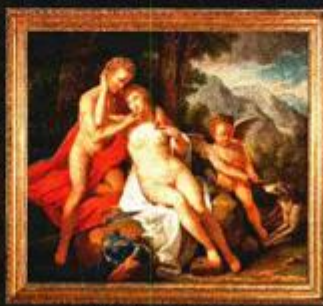
VENERA I ADONIS ULJENA PLATNU IZ 18. ST.