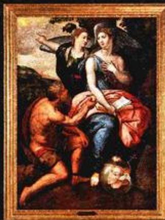
ALEGORIJA ULJE NA PLATNU IZ 16. ST.