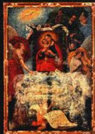
BOGORODICA POMOĆNICA ULJE NA PLATNU IZ 19. ST.