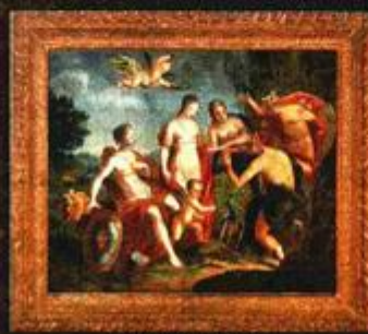
PARISOV SUD ULJENA PLATNU IZ 18. ST.

Radovi iz nekadašnjeg jugoslavenskog veleposlanstva restaurirani su u Zagrebu