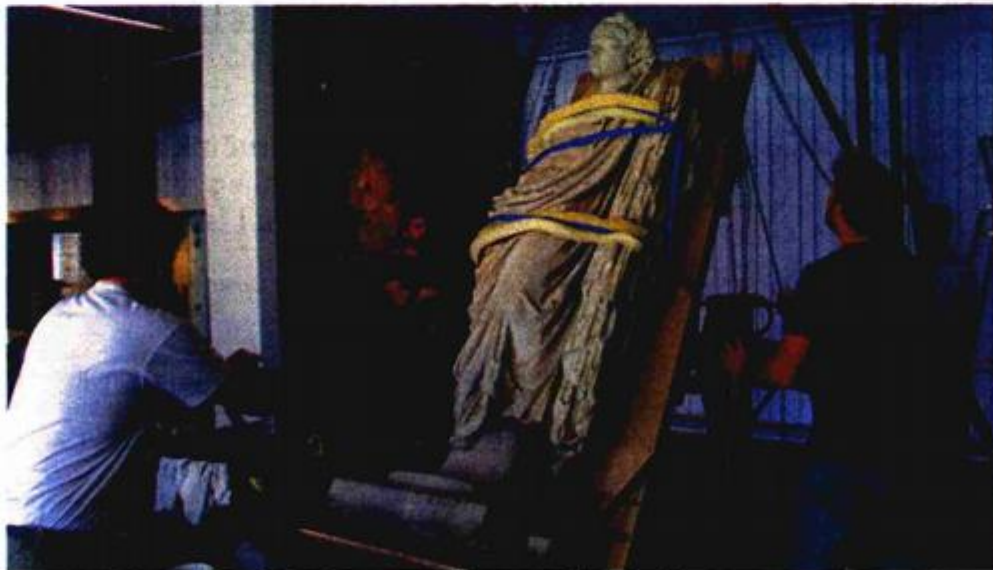
Za Arheološki muzej Zadar radi se na svjetski poznatoj skulpturi Augusta

– Prije postojanja studija, poslove u ovoj struci radili su priučeni ljudi, najčešće sa završenom srednjom školom likovnog smjera te su u muzejima imali stručno zvanje "preparator". Bilo je i ljudi sa završenom likovnom akademijom koji su imali zvanje "restaurator". Ta su se zvanja dobivala nakon položenog državnog stručnog ispita iz ove struke. Zašto ovaj uvod? Zbog toga što je i danas prisutna situacija da se restauratorskom djelatnošću može baviti osoba koja nakon određene stručne sprema, dakle ne nužno studija konzervacije i restauracije, i stažiranja od dvije godine u