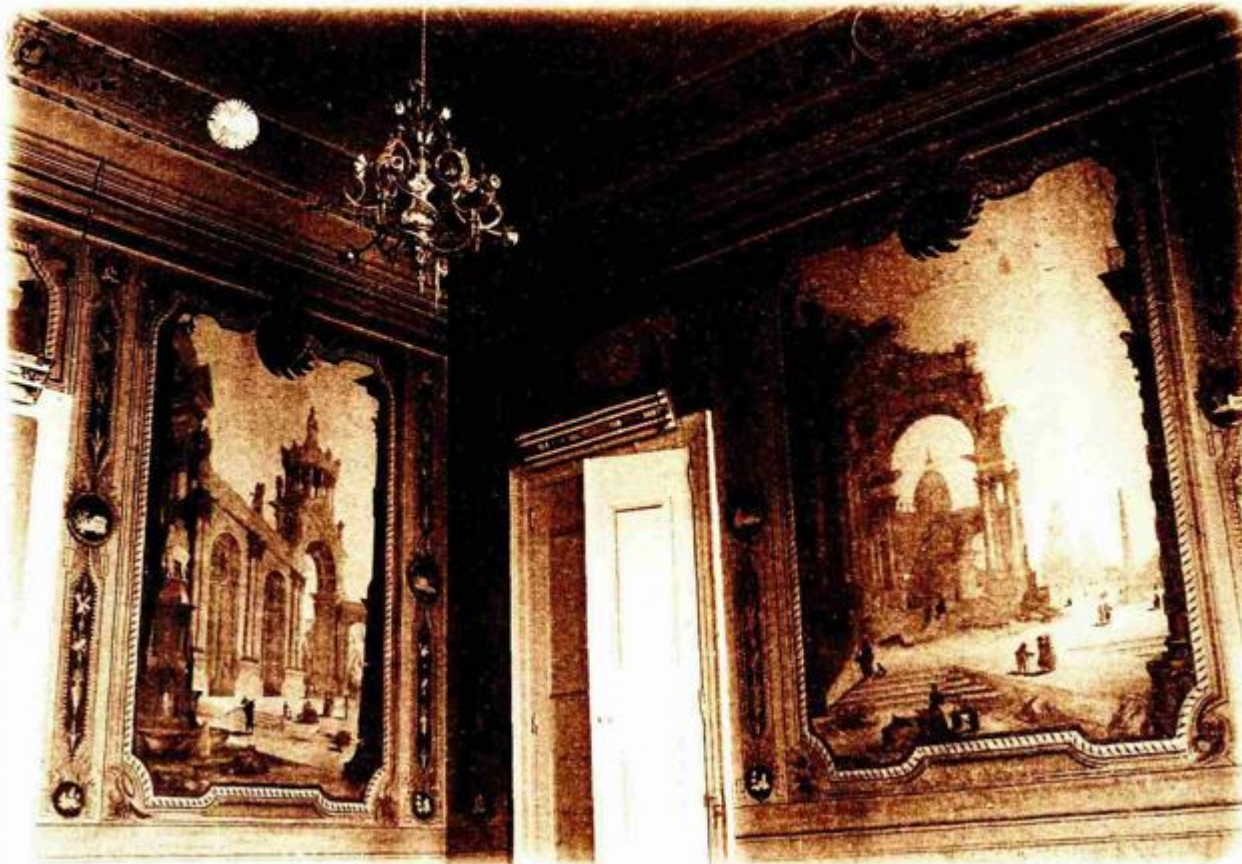
Izgradnja Palače rafinerije šećera započela je 1752. godine.

odnosno otkada je Grad postao vlasnikom kompleksa. Tijekom vremena pojavilo se nekoliko prijedloga revitalizacije, riječki kulturnjaci predlagali su da kompleks postane riječki Museum Quartier, napravljen je i projekt novog Muzeja moderne i suvremene umjetnosti, koji je trebao nastati prenamjenom i dogradnjom T-objekta unutar kompleksa. Govorilo se i o gradnji hotela u kompleksu, međutim, ništa od toga do danas nije realizirano. Novim sporazumom Ministarstva i Grada namjerava se pripremiti projekt za financiranje iz strukturnih fondova Europske unije i stvoriti preduvjete da se u nekom razumnom roku, a svakako do 2020. godine, cijeli kompleks uredi i da svi objekti (uključujući i hotel koji će se graditi privatnim sredstvima) budu u funkciji. 6 Čini mi se da se tako artikulira želja velike većine Riječana da se vrati život u srce, središte Rijeke. Naime, velikim komercijalnim investicijama Rijeka se disperzirala na zapadni i istočni dio, zanemarujući svoj centar. Do, nadamo se, uspješne i konačne realizacije ne preostaje nam ništa drugo do čitanja monografije i novih izdanja CD ROM-a i WEB-portala o Palači šećerane u Rijeci.