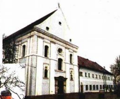
Izgled obnovljenih elemenata sjevernog/zapadnog i južnog/istočnog pročelja