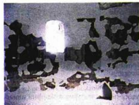
Pogled na očuvane zidne oslike i kustodiju u svetištu