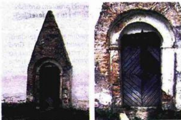
Izgled romaničkog ulaznog portala i vratnica u tijeku radova obnove

Posljednja cjelovita obnova crkve sv. Martina provedena je u razdoblju 1998.-2010. godine u sklopu višegodišnjih zaštitnih konzervatorsko-restauratorskih radova koje je vodio Hrvatski restauratorski zavod iz Zagreba, a arheološka istraživanja proveo je Muzej broskog Posavlja. U arheološkim sondama oko perimetralnih zidova otkriveni su temelji i dio zida starije građevine na kojima je podignuta postojeća romanička crkva sv. Martina. Tlocrtni oblik ukazuje nam da se radi o građevnim ostacima starije romaničke crkve koja je bila jednobrodna s polukružnim svetištem. Zide crkve sačuvano je nejednakoj visini od cca 0,80- 1 m. Način zidanja i veličina kamena lomljenjaka ukazuju da je vjerojatno riječ o crkvi koja je mogla biti građena oko 1100. godine, u vrijeme kada su građene crkve s polukružnim svetištema kao što su sv. Ilija u Vinkovcima-Meraja, crkve u Borincima i Rudinama. ( nastavlja se)