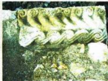
Ulomak oltarne pregrade: U gornjem redu niz kosih kuka, a u donjem troprutna pletenica... Dimenzije: vis. 25,5 cm, duž. 55 cm, deb. 11 cm; vapnenac

Vjerujem kako će se ova dva kamena fragmenta ubrzo pridružiti ostalim kamenim spomenicima u trijemu (uz nužnu zaštitu) na šematoriju stare nestale crkve sv. Jurja u Drašnicama na Kraju.