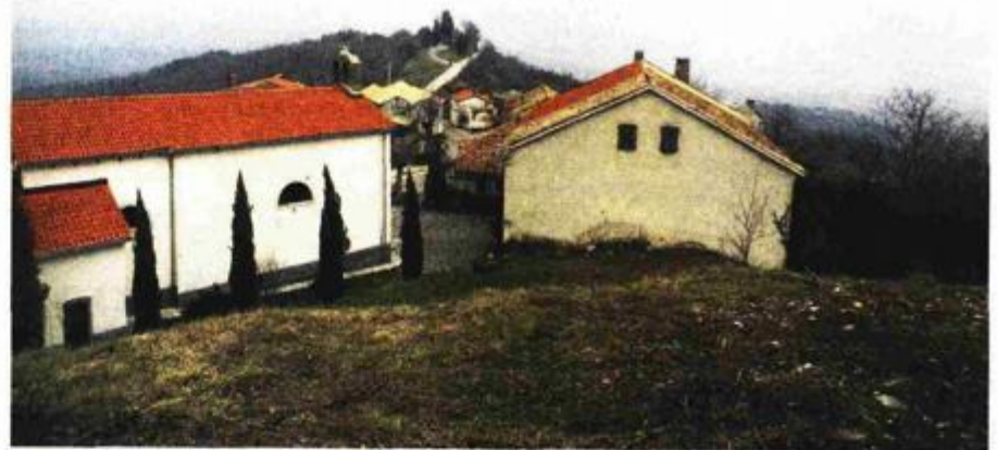
S Paza se u prošlosti kontrolirao istočni ulaz u Istru

Veće količine keramičkog materijala potvrđuju da je utvrda bila nastanjena tijekom 15. i 16. stoljeća odnosno da je izgrađena krajem 14., a uništena početkom 17. stoljeća