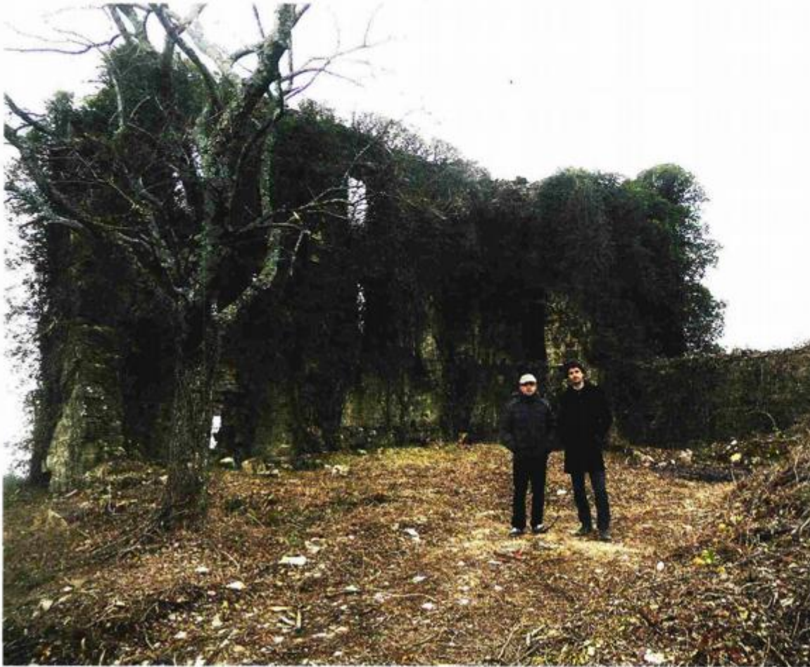
Obnova kaštela u Pazu