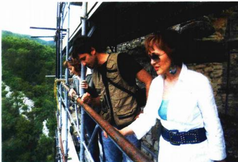
Skele na južnom zidu, nad strmom liticom