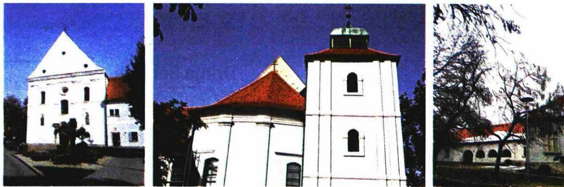
Crkva Sv. Trojstva sa samostanom u Slavenskom Brodu i Zgrada Gradskog magistrata (danas MBP)

Zgrada Gradskog magistrata u Slavenskom Brodu registrirano je kulturno dobro RH kao Z-1296, a zatvara Trg Presvetog Trojstva sa sjeverozapadne strane pored Franjevačkog samostana i Vatrogasnog doma. Tlocrtno je u obliku obrnutog slova "Z". Najstariji dio zdanja, sjeverno i središnje krilo u obliku slova "L", nastao je osamdesetih godina 18. st. Građevina je dograđivana u 19. stoljeću. Visoka je prizemnica, dijelom podrumljena s bačvastim svodom u zapadnom krilu. Skromne je i sudržane plastike pročelja, što odaje barokno-klasicističku zamisao u izvedbi sklopa. Prozorski otvori obrubljeni su okvirima s "uškama". Lučni prolaz između dva dijela zgrade vodi do arkadnog trijema na zapadnom krilu, a zatvaraju ga reprezentativne kovane vratnice. U tijeku su pripreme za radove rekonstrukcije prema kojoj će Muzej Brodskog Posavlja dobiti kvalitetan novi prostor u kojem će muzejske zbirke ponovno zasjati.