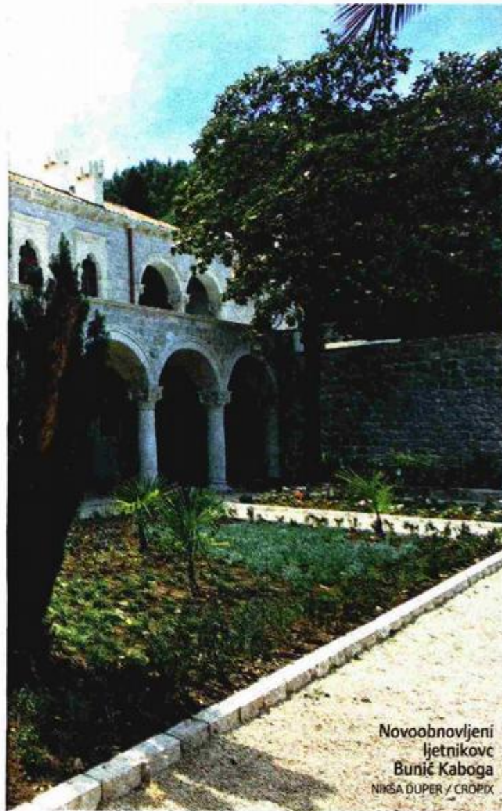
Novoobnovljeni ljetnikovac Bunić Kaboga

re i restauratore, koji svaku stvar moraju napraviti precizno. Tako se dijelove, potajno i "preko reda", nosilo na magnetnu rezonanciju. Kako je kazala ministrica Zlatar Violić, rezultat obnove ogledalo je triju struka. Posebno je naglasila kako nitko od samostalnosti Republike