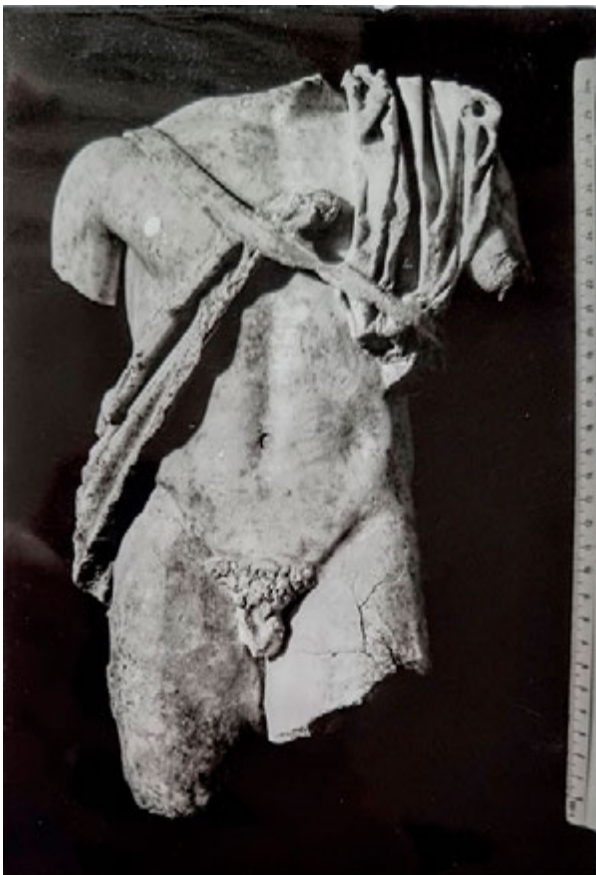
6. Pilot kamena skulptura (snimka: I. Donelli, 1996.) Pilot stone sculpture (I. Donelli, 1996)