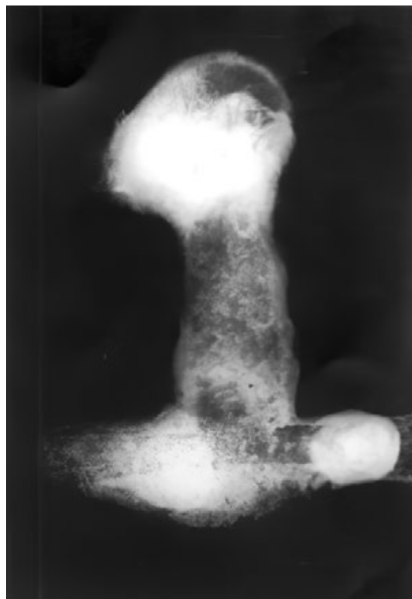
3. Rendgenski snimak ručice mača (snimka: I. Donelli, 2008.) X-ray image of a sword grip (I. Donelli, 2008)