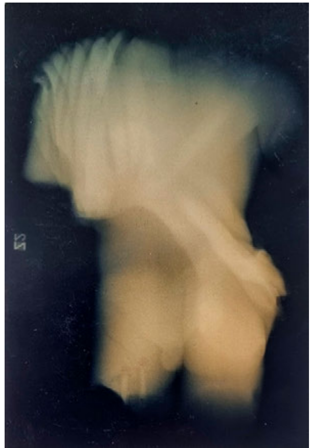
7. Rendgenski snimak (snimka: I. Donelli, 1996.) X-ray (I. Donelli, 1996)