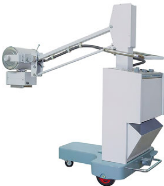
11. Prenosivi RTG uređaj koji se nalazi na UMAS-u (snimka: I. Donelli, 2015.) Portable X-ray device located at the Arts Academy in Split (I. Donelli, 2015)

Također, na Umjetničkoj akademiji na Odsjeku za konzervaciju-restauraciju, 2006. se godine oformljuje radiografski laboratorij te se instalira prenosivi RTG uređaj koji je donirala Opća bolnica Dubrovnik, kao i digitalizator za nastajanje digitalnih radioloških slika koji je donirao KBC Split. Na tom je prenosivom RTG uređaju snimljen čitav niz umjetničkih i arheoloških artefakata za potrebe studenata i profesora s Odsjeka konzervacije-restauracije (sl. 11). U zadnjih 10 – 15 godina, CT i rendgenski uređaji primjenjuju se i u drugim srodnim institucijama u Dalmaciji. 16 Tako, na primjer, pomoću CT uređaja, na Sveučilištu u Dubrovniku na Odjelu za umjetnost i restauraciju, osim štafelajnih slika i polikromiranih drvenih skulptura, kolegica doc. dr. sc. Danijela Jemo snima pojedine liturgijske predmete od tekstila i kože. Odjel Hrvatskog restauratorskog zavoda u Splitu koristi CT, osim za snimanje slika starih majstora, i prenosivi RTG uređaj za snimanje dijelova Buvinovih drvenih vratnica iz splitske katedrale sv. Duje, kao i za snimanje drvenih korskih sjedala. Također, zadarski odjel Hrvatskog restauratorskog zavoda, a i Arheološki muzej, za svoje potrebe, umjetnine snimaju u zadarskoj bolnici. Najnoviji rezultati primjene rendgena dolaze iz Arheološkog muzeja u Splitu gdje su konzervatori pokušali snimiti mramornu antičku