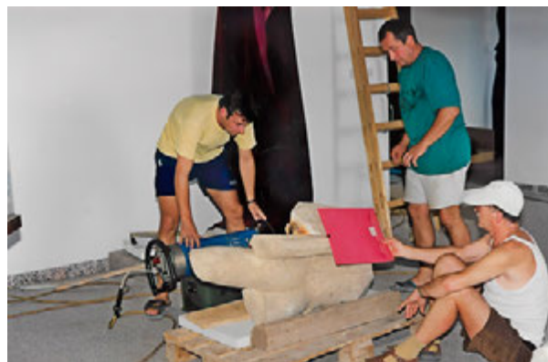
9. Pozicioniranje rendgena i skulptura u Naroni – Vid (snimka: I. Donelli, 1997.) Positioning X-ray machine and sculptures in Narona–Vid (I. Donelli, 1997)

od 24 cm (sl. 10). Međutim, izvještaj Zavoda za raziskavo materiala in konstrukcij iz Ljubljane iz 1991. godine donosi analizu radiografskog snimanja mramornog kipa nadnaravne veličine Augusta Imperatora u Arheološkom muzeju u Zadru. Ovaj je kip imao pukotinu u bazi te mu je prijetilo odlamanje fragmenata nogu i same baze, odnosno rušenje same skulpture. Iz izvještaja čitamo da su Slovenci upotrijebili radioaktivni izotop \text{Co}^{60} , te su na taj način prozračili 40 cm debelu kamenu masu, no u izvještaju autori nisu naveli ni tip uređaja ni specifikaciju filmova. Za snimanje je korišten radioaktivni izvor \text{Co}^{60} koji raspadom emitira gama-zračenje čije zrake imaju veću prodornost od X-zraka. Raspadom radioaktivnog izvora nastaje elektromagnetsko zračenje, koje ima manje valne duljine i veće frekvencije od rendgenskog zračenja, što omogućava veću prodornost zračenja kroz materijal (npr. kamen). Prolaskom kroz materijal, gama-zračenje slabi (atenuira), kao i kod RTG zračenja, te izaziva fotoefekt koji se može zabilježiti na RTG snimci, tj. filmu, a danas i na drugim receptorima slike koji koriste digitalne sustave za konverziju zračenja u sliku. 15