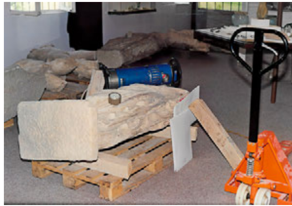
8. Snimanje mobilnim rendgenom (snimka: I. Donelli, 1997.) Mobile X-ray imaging (I. Donelli, 1997)

Ciljanim radiografskim snimanjima s odabirom odgovarajućih filmova za industrijsku radiografiju, tehnikom i parametrima snimanja, te stručnom obradom filmova, zaključili smo da se s ovakovim radiografskim uređajima može dobiti solidna podloga za dodatnu razradu i snimanje u laboratorijskim uvjetima. 14 Problem prozračivanja kamena rendgenskim uređajima koje smo imali na raspolaganju, nisu davali rezultate za kamene mase deblje