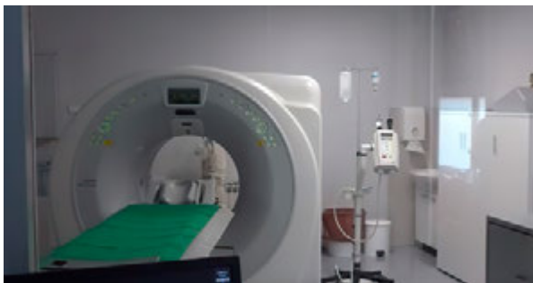
4. CT uređaj CT machine

slika koje su pripadale dalmatinskoj baštini, krajem 40-ih godina prošlog stoljeća u zagrebačkoj restauratorskoj radionici, ostavio konzervator Zvonimir Wyroubal. Navodi se, međutim, da u Hrvatskoj rendgen još nije postojao, tako da snimanje nije izvedeno. Nakon otvaranja restauratorske radionice u Splitu, ovom je neinvazivnom metodom snimljena jedna slika, Bogorodica s Djetetom iz crkve sv. Lovre u Trogiru, oko 1957. – 1964. godine, 6 međutim nije navedeno gdje je slika snimljena. Iz pisanih se podataka doznaje da je prvi rendgen u Split došao 1909. godine te da je bio instaliran u privatnom sanatoriju dr. Jakše Račića, dok je Civilna bolnica takav uređaj dobila tek 1940. godine, ali nemamo podatke jesu li na njima snimane umjetničke slike.