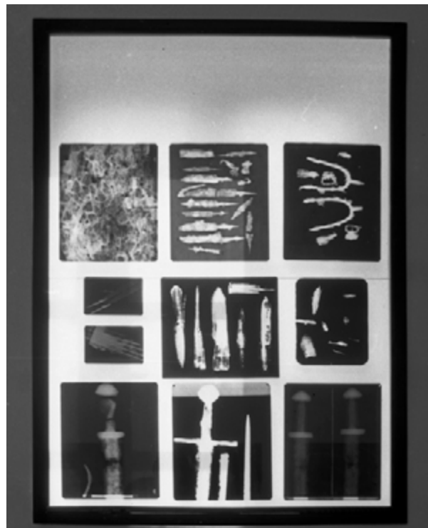
2. Rendgenski snimci metalnih predmeta iz Arheološkog Muzeja u Zadru X-ray images of metal objects from the Archaeological Museum in Zadar

Međutim, od svih materijala dosada se jedino nije snimao kamen. Nije mi poznato je li razlog što za tim nije bilo potrebe ili se na ovim uređajima nije mogao prozračiti. No pronalaskom mramornih skulptura u Augusteumu u Naroni (Vid) 1996. godine, kao preduvjet konzervatorsko-restauratorskim radovima pojavila se potreba snimanja skulptura rendgenom. Moram napomenuti da su mramorne skulpture nadnaravne veličine, neke i preko dva metra. U jednoj talijanskoj publikaciji iz područja povijesti, umjetnosti i arheologije, iz 1986. godine, T.H. Larson, autor članka Konzervacija mramornih skulptura Neptuna i Triton dijela fontane Lorenza Berninija navodi kako je, da bi dobio neke informacije o stanju mramora ispod erodirane površine, bio prisiljen primijeniti radiografsko snimanje. 12 Fizičko stanje 16 mramornih skulptura iz Narone – pukotine na samoj