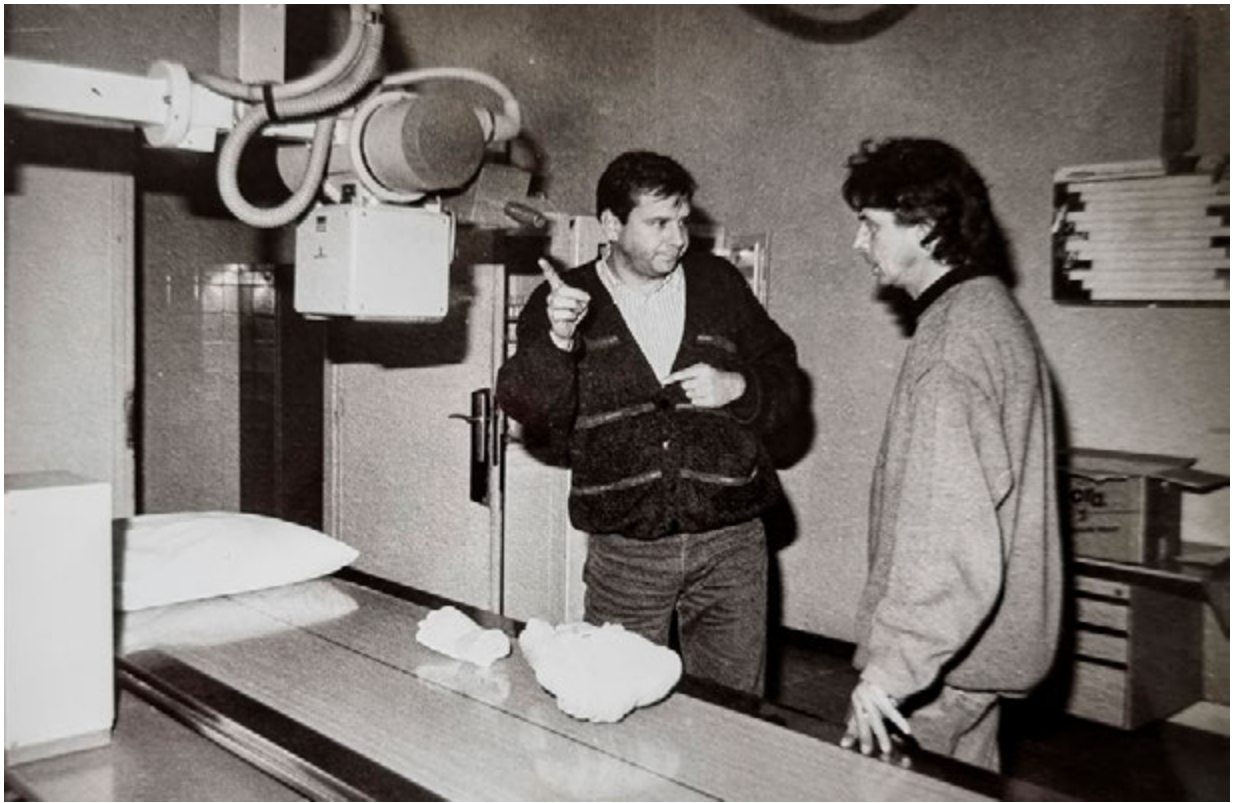
5. Snimanje arheološkog materijala rendgenom u KBC „Firule“ (snimka: I. Donelli 1996.) X-ray imaging of archaeological material at the Firule University Hospital in Split (I. Donelli, 1996)