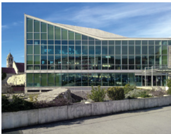
1. Gradska knjižnica „Juraj Šižgorić“ Šibenik Juraj Šižgorić City Library Šibenik

Antuna Vrančića Iter Buda Hadrianopolim (1774.) i govor Orationes duae reverendissimi Antonii Verantii, archiepiscopi Strigonensis (1793.). Sva knjižnična građa koja čini zbirku Rara smatra se prioritonom građom. Jedan odjel Knjižnice čini zavičajna zbirka Sibenicensia u kojoj je pohranjena građa koja se odnosi na Šibenik i njegovo područje, bilo sadržajem ili autorstvom, bilo mjestom izdavanja. Sadrži monografije, serijske publikacije, rukopisnu građu, audiovizualnu građu, zemljovide, slikovnu građu (likovni radovi, reprodukcije, portreti, fotografije, razglednice), polupubliciranu građu (znanstvene i stručne polupublikacije, društveno-političke publikacije, programe i izvještaje o radu poduzeća) i efemernu građu (plakati, leci, ulaznice i sl.). Vrijedan dio zbirke su stare novine i časopisi koji su izlazili na šibenskom području. Od katoličkog tiska posjeduju prvi časopis Schematismus cleri dioecesis sibenicensis (1893.), a od svjetovnog prve novine Hrvatska rieč (1905. – 1914.) i časopis Hrvatski dom: nova hrvatska pismarica (1924.). Na Audiovizualnom odjelu smješteno je oko 12 000 glazbenih CD-ova i oko 15 500 DVD-ova, a na istom je mjestu i referentna zbirka koja se odnosi na sva područja glazbene i filmske umjetnosti. 2