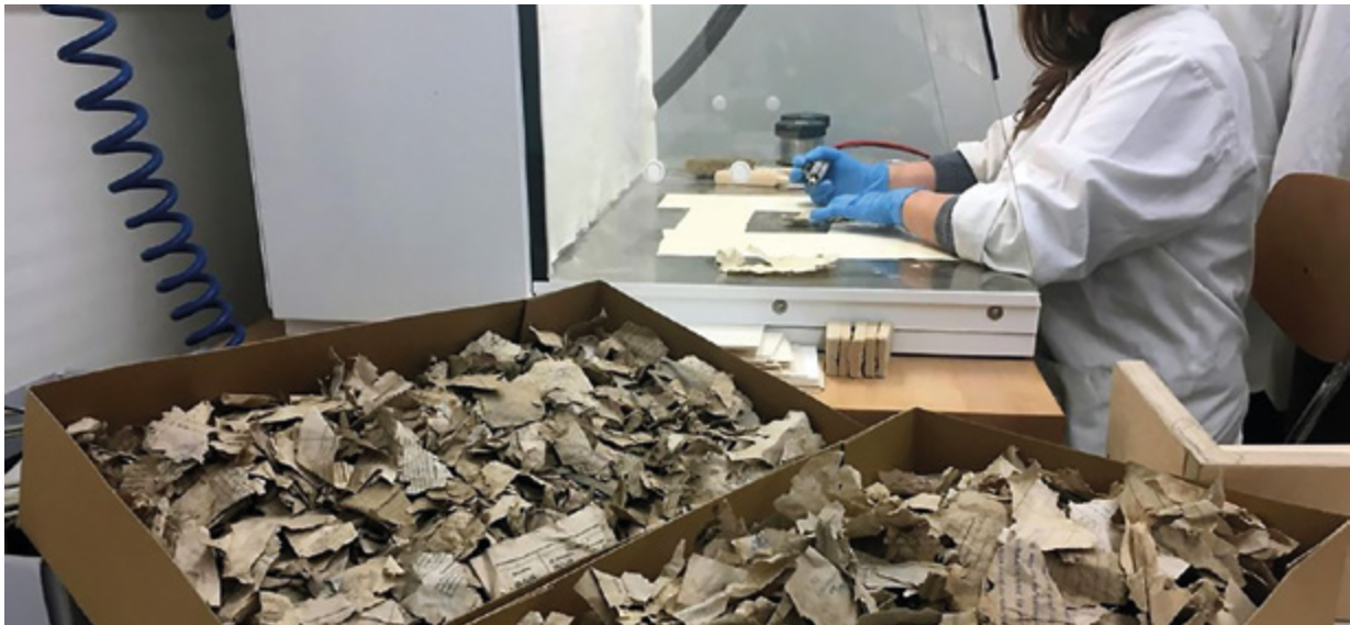
6. Gedächtnis von Köln , koji je tijekom urušavanja rastrgan u tisuće komadića, restauratorica ponovno sastavlja pincetom (Kölner Stadtarchiv, snimio R. Goldmann, 17. ožujka 2017.) Restorer reassembling Gedächtnis von Köln, torn into thousands of pieces during the collapse, using tweezers (Kölner Stadtarchiv, R. Goldmann, 17 th March 2017)

tintom topivom u vodi. Zbog individualnog rukovanja svakim gradivom, ta metoda je najskuplja metoda sušenja. 33