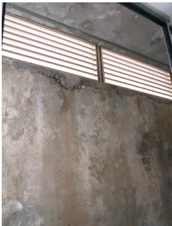
2. Odzračne rešetke iznad kanala prozora u Gradskoj knjižnici „Juraj Šižgorić“ (snimila I. Car, 22. srpnja 2016.) Ventilation grilles above the window channel in the Juraj Šižgorić City Library (I. Car, 22 nd July 2016)

Jedan od vrijednijih nastradalih primjeraka zbirke Rara je prvi broj prvih novina na hrvatskom jeziku – Kraglskog Dalmatina (Kraljskog Dalmatina) 7 – koji datira iz 12. srpnja 1806. godine. Il Regio Dalmata – Kraglski Dalmatin izlazio je u Zadru od 1806. do 1810. godine kao dvojezični službeni list na hrvatskom i talijanskom jeziku, a pokrenula ga