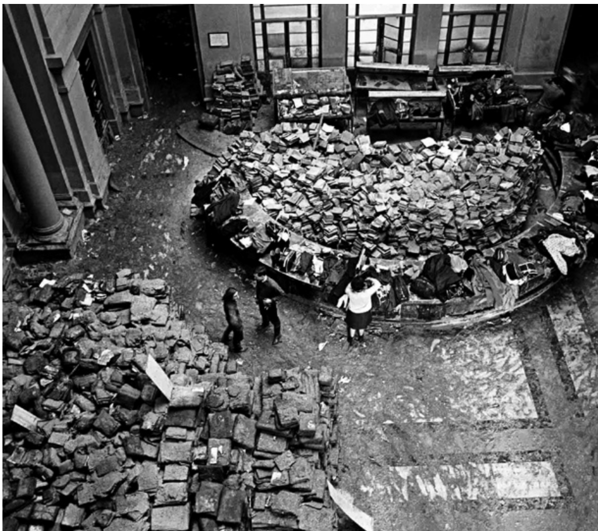
4. Poplava u Nacionalnoj knjižnici u Firenci 1966., Left.it (Biblioteca Nazionale Centrale, snimio B. Korab, 1966.) Flood at the National Library in Florence in 1966, Left.it (Biblioteca Nazionale Centrale, B. Korab, 1966)

nego na temperaturi od -20 do -30 °C. Na građi tiskanoj na papiru s premazom primijećena su nepovratna sljepljivanja, pogotovo na knjigama čuvanima na relativno visokim temperaturama. 13